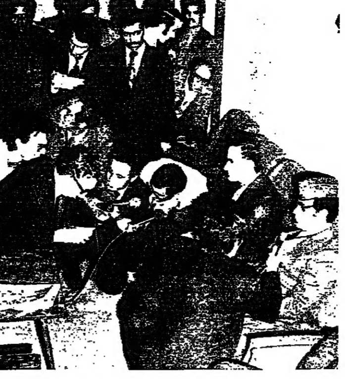
الرئيس الاسد والرئيس الليبي القذافي يتحدثان الى الصحفيين في طرابلس الغرب امس

فكرت مصادر اسرائيلية امس ان المصريين لم يسمحوا للقوات الاسرائيلية من سيناء الا الذي يشكل انتهاكا لاتفاقية الرباط. وقالت صحيفة «جورنال بوست» ان الجنرال سيلانجيو الحرس الداخلي اقوات الطوارئ ابلغ عزرا وايزمان وزير الدفاع الاسرائيلي امس الاول ان المصريين عدوا بسحب هذه القوات في منتصف الاسبوع المقبل. وتكررت صحف اسرائيل: ان مراقبي الامم المتحدة كانوا موجودين كخبراء في المنطقة الخاضعة لسيطرة المصريين. وقالت الصحف ان المصريين اعطوا انهم اكتشفوا جنح ٣ جنود اسرائيليين سقطوا في حرب تشرين، وانهم يعتزمون اطلاقها الى اسرائيل. القدس - وصرح